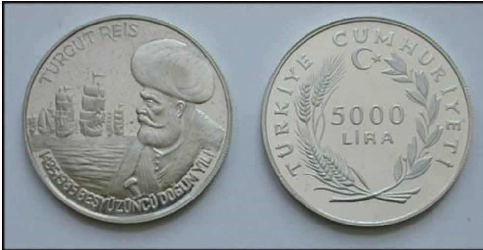
Moneda de curs legal de 5.000 Lires encunyada el 1985 a Turquia

La batalla de Cullera va ser violenta. Els primers reforços provinents de Sueca i Alzira obligaren els corsaris a desembarcar més homes: fins i tot Dragut en persona baixà a terra per contenir la defensa de la vila i donar temps als seus homes a acabar el saqueig i reembarcar. Un cop segurs als vaixells, Dragut hissà la senyera per negociar el rescat dels captius i dels béns, tasca a la qual dedicaren tot el dia 25 de maig (Pardo, 1997; 82).